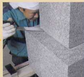
あんしん棒ねじ込み固定