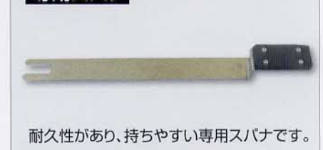
耐久性があり、持ちやすい専用スパナです。