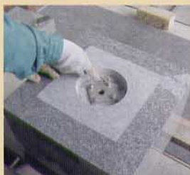
金具簡単取り付け

「組立作業手順」 シンプルな構造をしているため、取付けや取外しが容易でスピーディーです。