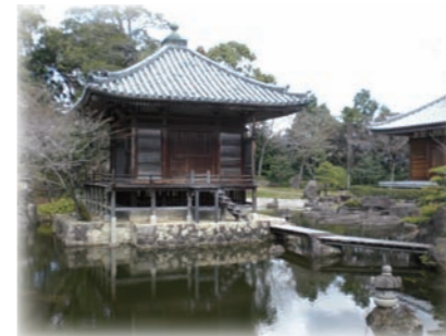
和歌山市田辺市 高山寺