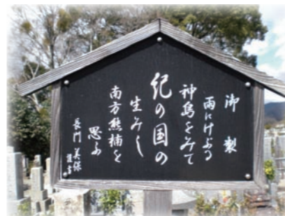
1962年(熊楠の死の20年後)昭和天皇が和歌山を訪れ、神島をみて詠んだ歌