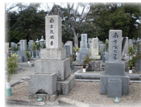
右側は南方家先祖代々の墓