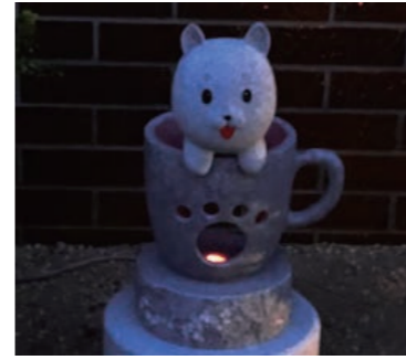
【カップの中からこんにちワン！】