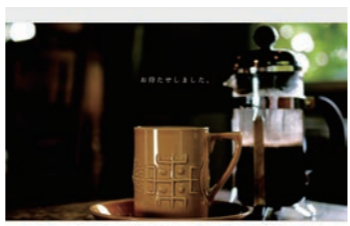
高松市美術館 × 庵治石

美術館とコラボしているだけあって展示スペースも見ごたえのあるものでした。カフェは期間限定営業で残念ながら終了してしまっていますが、またこんなすてきなコラボに出会えるのが楽しみです。