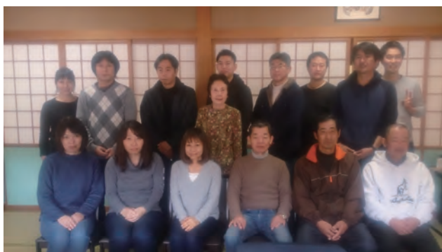
本年もどうぞよろしくお祈り申し上げます 有限会社庵治石彫工房 社員一同