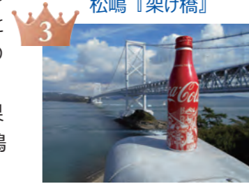
木村『飲み切れるかな?』