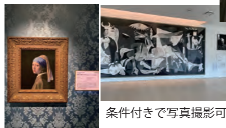
条件付きで写真撮影可能です