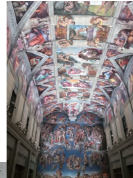
システーナ・ホールは圧巻