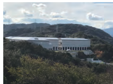
大塚国際美術館外観