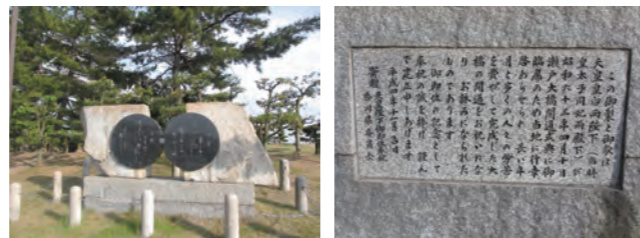
瀬戸大橋与島パーキングエリアにて

これは天皇陛下（現上皇陛下）・皇后（現上皇后）が瀬戸大橋開通に合わせて詠まれた歌碑です。