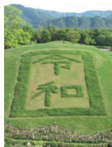
讃岐まんのう公園にて

新元号「令和（れいわ）」が5月1日に発表されました。日本で最初に採用された元号は、西暦645年に孝徳天皇が定めた「大化」。それから1300年余り経過した「平成」まで247の元号が使われてきたそうです。改元に合わせて2019年のゴールデンウィークは10連休になり、今までにない混雑を経験されたのではないかと思います。