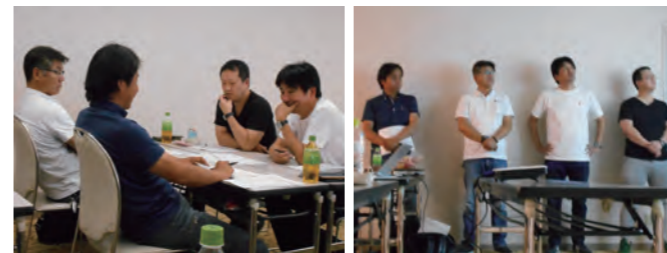
アクションプランについて話し合う