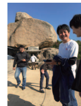
小瀬の重ね岩の前で談笑