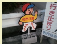
スポンサー付坊や