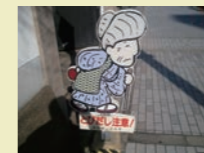
大阪府のお婆ちゃん