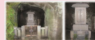
陸奥 宗光墓所(神奈川県鎌倉市:寿福寺)