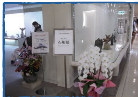
そごう徳島店 5F 美術画廊