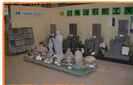
様々な石製品を展示いたします