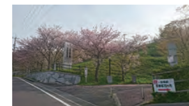
【石匠の里公園の桜】 石のオブジェがたくさんある公園