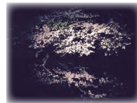
【栗林公園の夜桜】 ↑西湖の水面に映る桜 ←ライトアップされた桜のトンネル