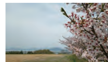
【さぬきワイナリーの桜】 ↑瀬戸内海を見渡す大串半島 ←四国初のワイナリー