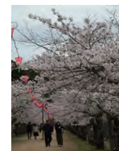
【鶴亀公園の桜】 東讃きっての桜の名所